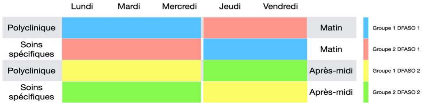
Répartition des binômes d'étudiants au semestre 1