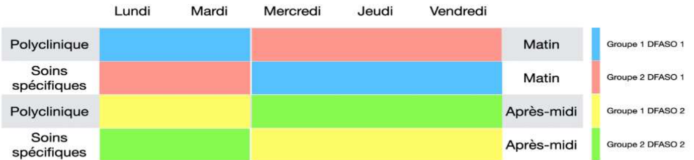
Répartition des binômes d'étudiants au semestre 2