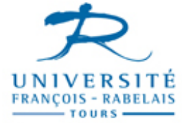
Schéma directeur pluriannuel handicap 2017 – 2020

Le Schéma Directeur est rédigé en Arial 14, non-justifié, afin de le rendre lisible selon de critères référencés pour quelques troubles du langage.