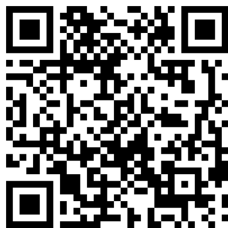
QR code App Store