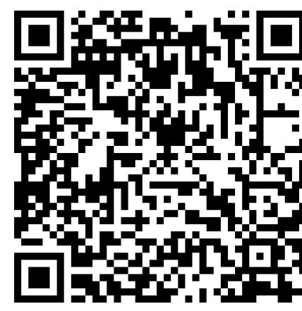
QR code Google Play