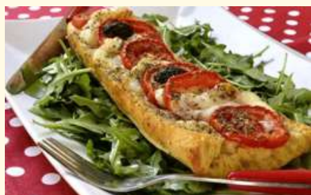
LA BAGUETTE DE PAIN PERDU FACON PIZZA