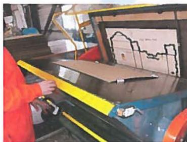
Découpe du carton sur une presse platine

VIDEAL ILLE 35 SARL au capital de 15 000€ ZAC Les Monts Gaultier - 12, rue Lavoisier 35230 NOYAL-CHÂTILLON-sur-Seiche Tél : 02 99 05 20 90 Fax : 02 99 05 23 15 SIRET 450 991 666 00014 - APE 8130Z - RCS Rennes