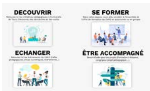
Page d'accueil du site de la pédagothèque pedagotheque.univ-tours.fr

Ce portail est aussi un espace pour se former en autonomie (via la plateforme CELENE) ou s'inscrire à des formations collectives (via l'application GEFORP). De multiples ressources (guides pédagogiques, outils numériques, webinaire etc) sont à la disposition des enseignants (figure 1). Le site s'enrichit continuellement des ressources produites par les pôles qualité et accompagnement du CAPE, faisant de la « pédagothèque » un outil précieux au service de la qualité des formations.