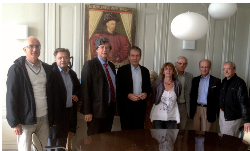
Rencontre des équipes présidentielles des universités de Poitiers et de Tours